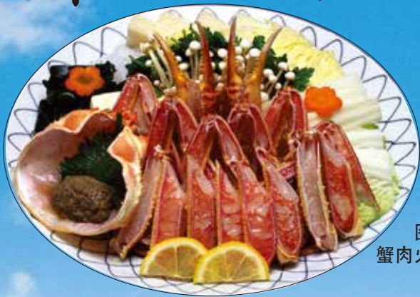
图片所示 蟹肉火锅为2人份