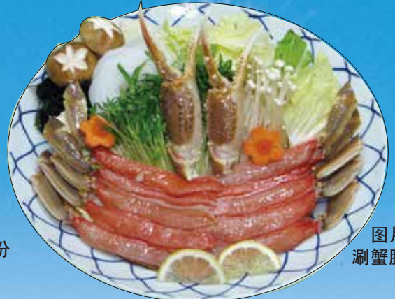
图片所示 涮蟹脚为2人份

▲ ズワイかにすき 一人份 雪蟹螃蟹肉火锅 雪蟹螃蟹肉火锅 4,259円(4,600円(税込))