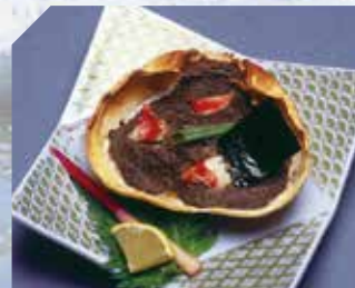
かにみそ甲羅焼き Roasted Crab Tomalley on shell 900円(972円(税込))