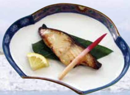
銀ダラ西京焼き Grilled Sable fish marinated with Miso 1,000円(1,080円(税込))