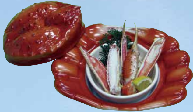
ズワイかに宝楽焼き Roasted Snow Crab 1,500円(1,620円(税込))