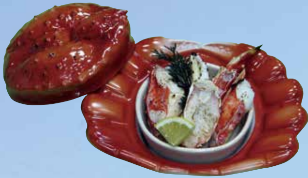
本タラバかに宝楽焼き Roasted King Crab 2,550円(2,754円(税込))