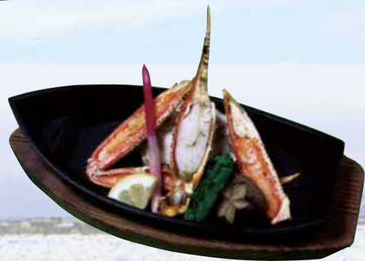
ズワイかに鉄船焼き Butter roasted Snow Crab 1,550円(1,674円(税込))