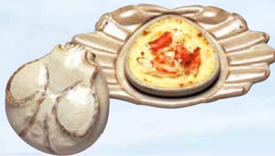
かにグラタン Crab Gratin (White cream sauce) 950円(1,026円(税込))