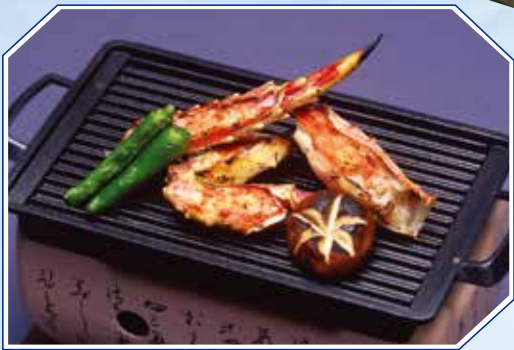
▲本タラバかに風味焼き Roasted King Crab "FUUMIYAKI" Cooked at your table 2,400円(2,592円(税込))