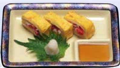
▲かにだし巻玉子 Japanese style rolled omelette with Crab 800円(864円(税込))