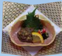
▲かにみそ Crab Tomalley 600円(648円(税込))