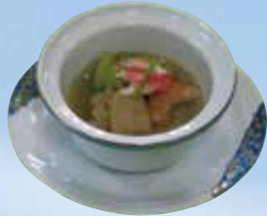
▲かにみそ北海煮 Crab & vegetables in Crab Tomalley 800円(864円(税込))