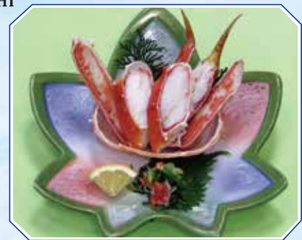
▲味くらべかに酢 Assorted Boiled Crab with vinegar 2,000円(2,160円(税込))