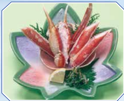
▲ズワイかに酢 Boiled Snow Crab with vinegar 1,550円(1,674円(税込))