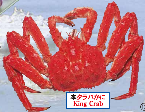
本タラバかに King Crab