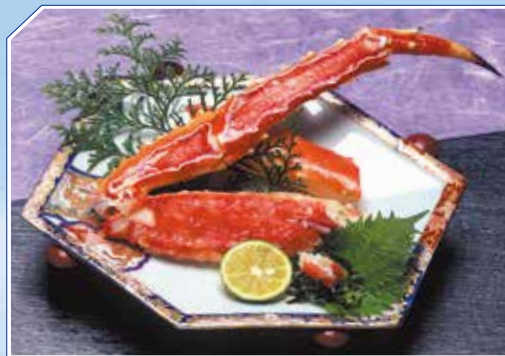
▲豪快一本足(ゆでタラバかに足一本) Boiled King Crab Leg "IPPON ASHI" 2,200円~3,900円(税込)