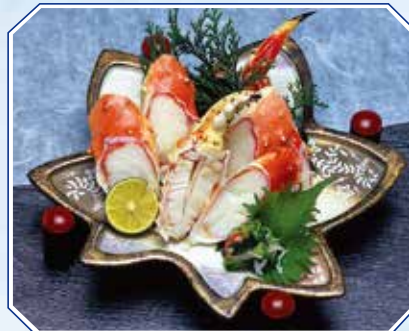
▲本タラバかに酢 Boiled King Crab with vinegar 2,600円(2,808円(税込))