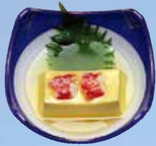
▲かに豆腐 Crab Tofu 480円(518円(税込))