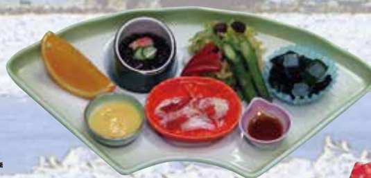
▲ベっぴんサラダ Assorted mini Salad 1,200円(1,296円(税込))

中盛(Medium)(約2~3人前) 大盛(Large)(約4~5人前) 5,000円(5,400円(税込)) 8,796円(9,500円(税込))