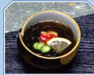
▲かにもずく Crab with MOZUKU Seaweed 580円(626円(税込))