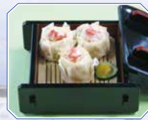
▲かにしゅうまい Steamed Crab dumpling 820円(886円(税込))