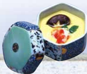
◀かに茶碗蒸し Japanese style egg custard (non-sweet) 800円(864円(税込))