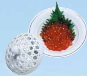
▲いくら風味(醤油)漬け Salmon roe soy sauce base 700円(756円(税込))