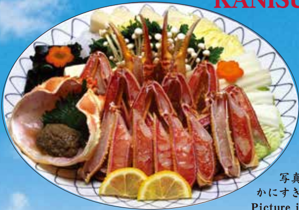
写真の かにすきは2人前 Picture is for two