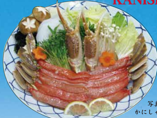
写真の かにしゃぶは2人前 Picture is for two