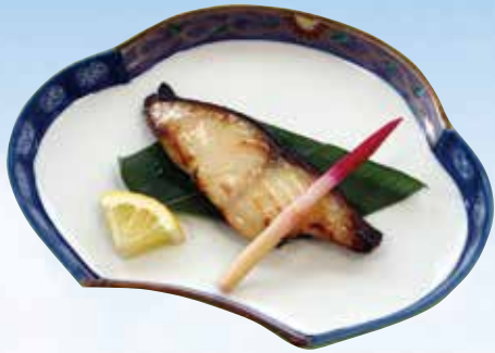
銀ダラ西京焼き Grilled Sable fish marinated with Miso 1,000円(1,080円(税込))