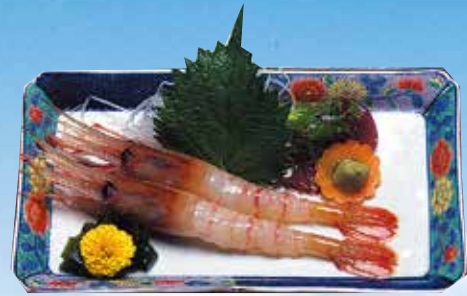
ボタンえび造り Sweet Shrimp Sashimi 1,400円(1,512円(税込))