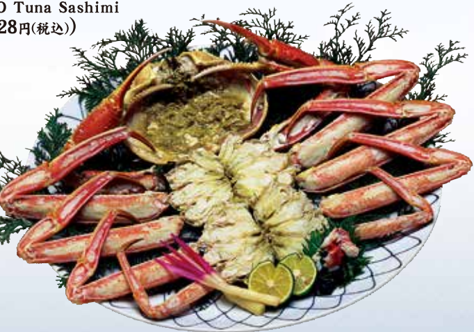
産直 ズワイかに姿ゆで (無冷凍) Boiled Snow Crab (Whole) 北海道もの Hokkaido (4月~8月) 4,500円~10,000円(税込) 山陰もの San-in region (11月~3月) 12,000円~21,000円(税込)