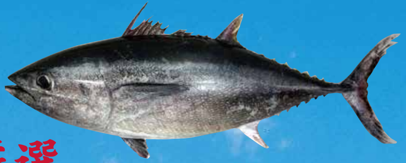
脂ののった本マグロなど...