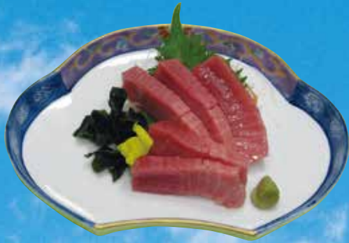
まぐろ中トロ TORO Tuna Sashimi 1,700円(1,836円(税込))