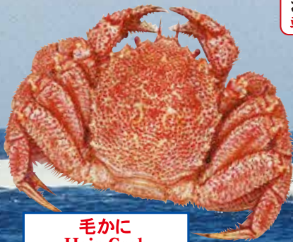
毛かに Hair Crab 冷凍品は一切扱いません