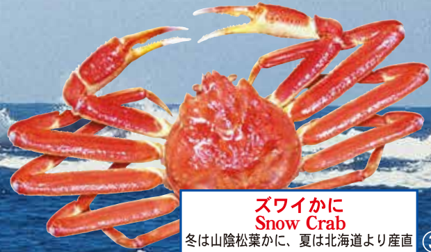
ズワイかに Snow Crab 冬は山陰松葉かに、夏は北海道より産直 ③